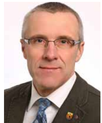
Norbert Möller Bürgermeister der Stadt Waren (Müritz)

Deshalb möchten wir natürlich auch für unsere Städte - beide idyllisch an Seen gelegen - werben. Besuchen Sie uns, genießen Sie die Ruhe und Natur oder betätigen Sie sich sportlich und aktiv am oder auf dem Wasser oder flanieren Sie durch unsere schönen Innenstädte. Wir wünschen Ihnen viel Spaß dabei.