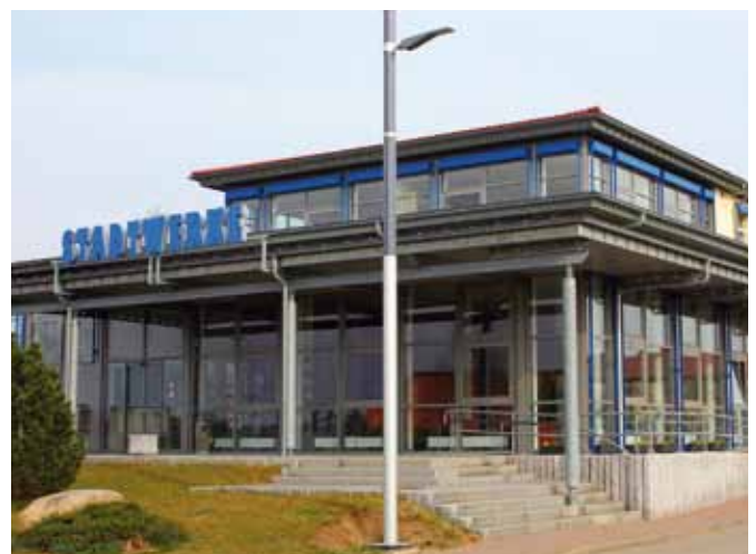
Firmensitz der Stadtwerke Waren GmbH