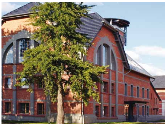
Firmensitz der Stadtwerke Prenzlau GmbH