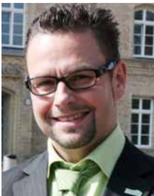
Hendrik Sommer Bürgermeister der Stadt Prenzlau

Gut geplante Investitionen in Erneuerbare Energien bedeuten für die Kommunen eine Vielzahl von heimischen Firmen, die sich an der Wertschöpfung aktiv beteiligen können. In Industrie, Handwerk und Dienstleistungsunternehmen entstehen neue Arbeitsplätze. Die öffentliche Hand profitiert durch Investitionen und Einkommen, Steuer- und Pachtzahlungen. Wir, die Bürgermeister der Städte Prenzlau und Waren (Müritz), wünschen der »Kommunalwind Nord GmbH« viel Erfolg und begrüßen die Tatsache, dass