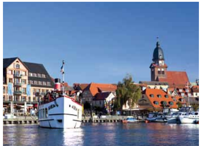
Waren – Mehr Müritz geht nicht.