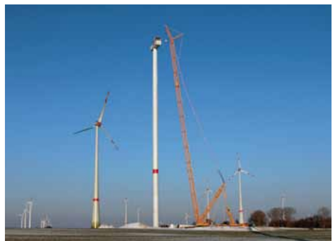
Hier wird, gemeinsam mit der ENERTRAG AG, eine Anlage in Blindow, bei Prenzlau, errichtet. Es handelt sich um eine Vestas V112 mit einer Nabenhöhe von 140 m, einer Nennleistung von 3 MW und einem Rotordurchmesser von 112 m. (Januar 2014)

Mit uns gehen Sie kein Risiko ein. Wir sind ein kommunales Unternehmen vor Ort. Unsere Gesellschafter sind seit über 20 Jahren erfolgreich am Markt aktiv und besitzen langjährige energiewirtschaftliche Erfahrungen.