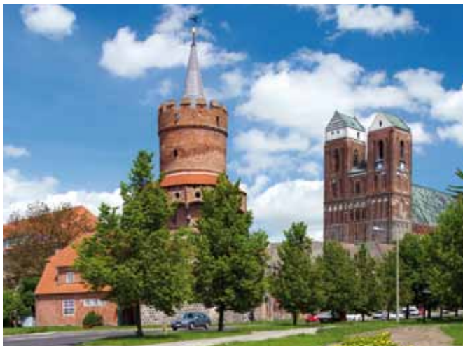
Prenzlau – Grüne Stadt am Uckersee